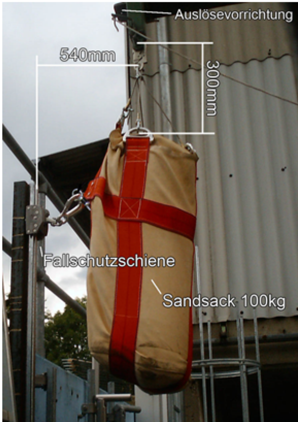
Abb2. Positionierung der Prüfgewichts