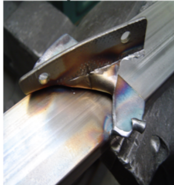
Bild Nr.4 Der Stufenwinkel ist gerissen.