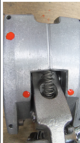
Foto 3: Detailaufnahme Gehäusehälfte links und rechts (Draufsicht)

Der Schraubensicherungslack muss so aufgetragen werden, dass der Innensechskant des Gewindestifts sowie das Gehäuse mit dem Schraubensicherungslack bedeckt ist (siehe Foto 3).