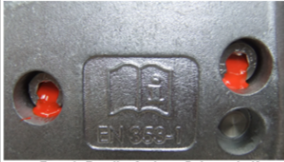
Foto 1: Detailaufnahme Gehäusehälfte rechts (Seitenansicht)

Der Schraubensicherungslack muss so aufgetragen werden, dass der Innensechskant der Zylinderkopfschraube sowie das Gehäuse mit dem Schraubensicherungslack bedeckt ist (siehe Foto 1).