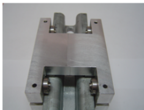
Bild Nr.4 Prüflehre über die gesamte Länge des Profils ziehen.