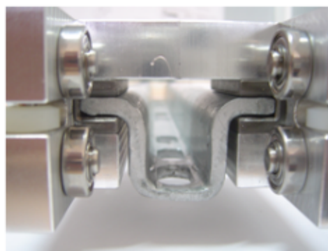
Bild Nr.3 Prüflehre- Aufschieben.