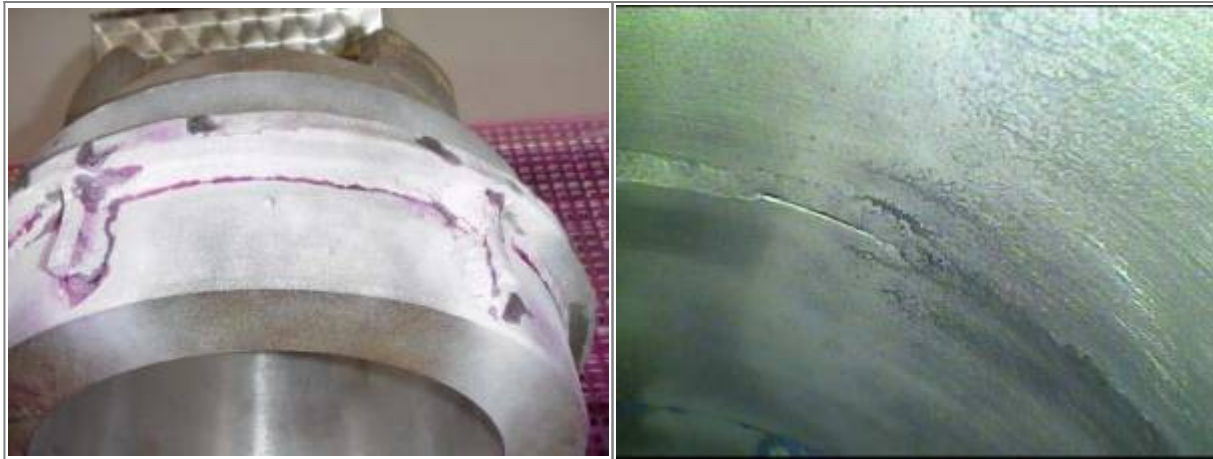
Bild 12. Bindefehler zur Oberfläche hin offen