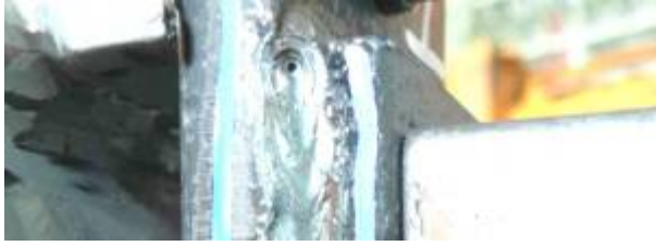
Bild 10: Offener Endkraterlunker