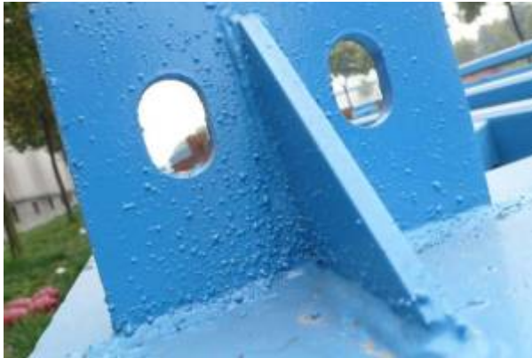
Bild 21: Schweißspritzer